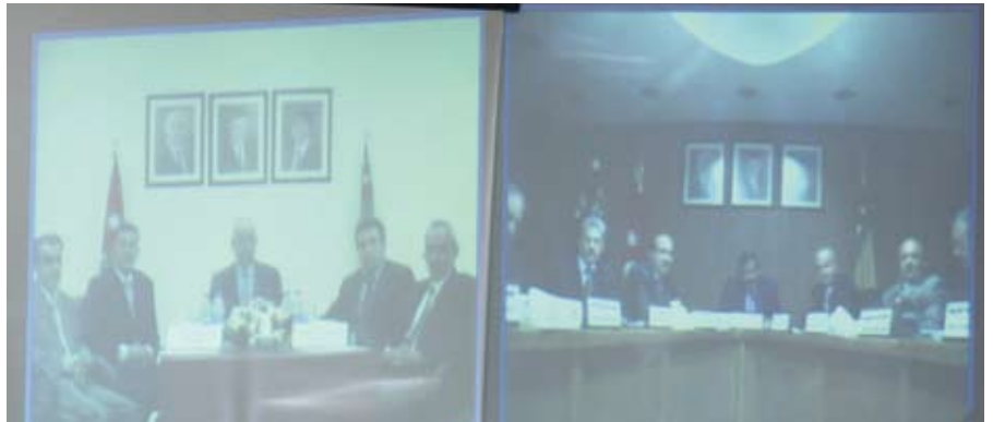
مجلس عمداء الأردنية في اجتماع عبر الفيديو

الجامعة - عقد مجلس عمداء الكليات في الجامعة «الأم» وأردنية العقبة اجتماعاً لهم عبر تقنية الربط الفيديوي "video conference" حيث أتاحت التكنولوجيا المتقدمة اللقاء بين من هم في الجامعة وأردنية العقبة في آن واحد الأمر الذي سهل على الجانبين الحوار دون أن يتجشمو عناء السفر. ولما كان اجتماع مجلس عمداء... التتمة ص ٨