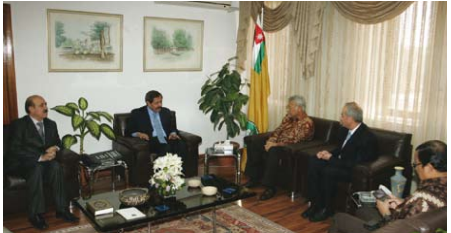
الدكتور الكركي مستقبلاً السفير الأندونيسي

بدوره عبر السفير الأندونيسي عن رغبة بلاده في زيادة حجم التعاون العلمي مع الجامعة الأردنية التي تحظى باحترام واسع في أندونيسيا.