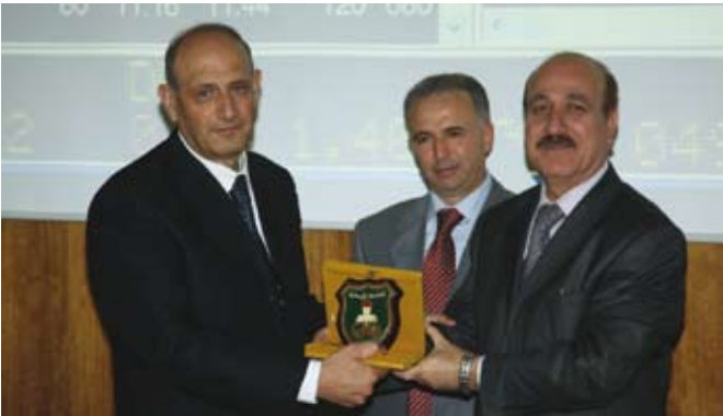
دفع الجامعة لبورصة عمان

وتم على هامش افتتاح المختبر التوقيع على مذكرة تفاهم بين الجامعة وبورصة عمان تضمنت بنودها التزامات الطرفين في إنشاء هذا المختبر.