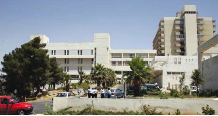
مستشفى الجامعة شاهد على الإنجاز

الجامعة - أعلن مدير عام مستشفى الجامعة الدكتور عبد الكريم القضاة حصول المستشفى على الشهادة الخاصة بالمواصفة المتعلقة بجودة وسلامة خدمات الغذاء "هاساب HACCP".