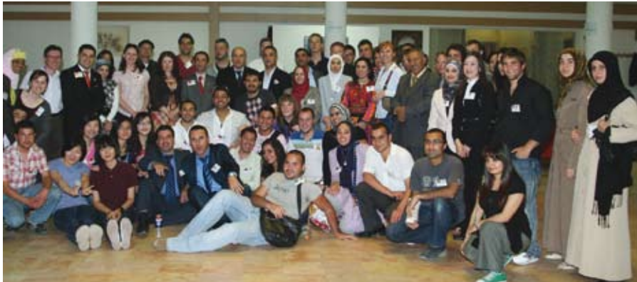
لقطة تذكارية لدارسي اللغة العربية في الجامعة