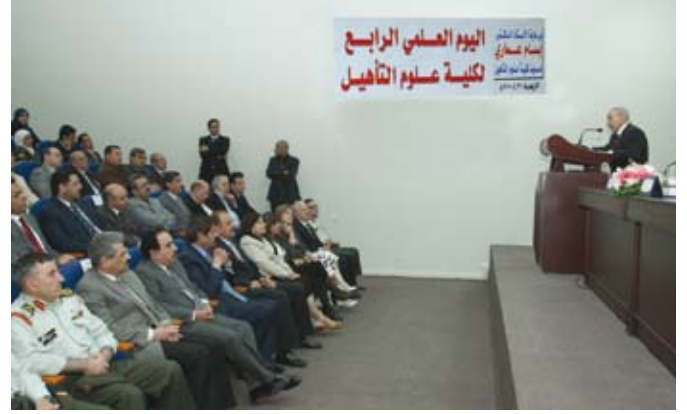
يوم التأهيل العلمي

عماري: اعتراف عالمي بتخصص العلاج الوظيفي