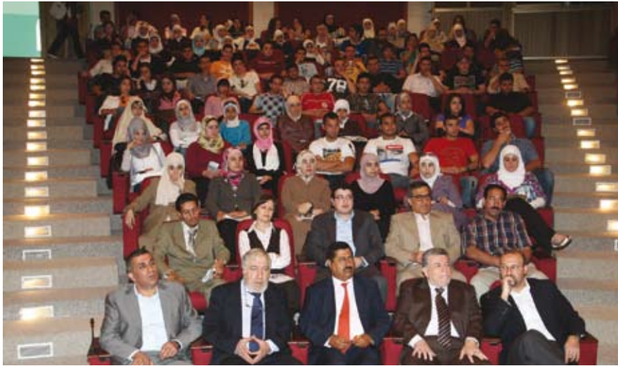
جانب من الحضور في الأسبوع المفتوح

هذا المشروع في انتخابات اتحاد طلبة الجامعة المقبلة وفي حال نجاحها يتم تعميمها على الجهات المعنية للاستفادة من هذا النظام الذي يوفر عملية التصويت لأعداد كبيرة واستخراج النتائج خلال دقائق معدودة. ومن بين المشاريع المنجزة أيضاً "مشروع التعليم الإلكتروني" وهو مشروع موجه للمشاركين في الدورات التدريبية المتخصصة والمتنوعة إذ يوفر النظام معلومات كافية عن الدورات ومواضيعها والمشاركين فيها وأهدافها ونتائجها العلمية. واستطاع الطلبة وضع أسس لمشروع "برمجة إنسان آلي" لاستخدامه في شركات ومصانع منتجة للأغذية والمشروبات المعبأة بحيث يتولى الإنسان الآلي وفقاً لنتائج المشروع تمييز المعلبات الفارغة من المعلبات المعبأة ويمكن تطوير المشروع ليتمكن الإنسان الآلي من معرفة القيمة الغذائية ومدى صلاحيتها للاستهلاك البشري.