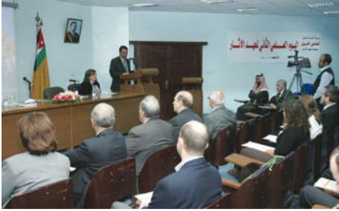
السياحة الوطنية في الأردن

خليل: الأردن سادس دولة في السياحة الثقافية