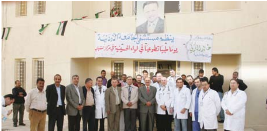
المشاركون في اليوم الطبي

الجامعة - نظم مستشفى الجامعة يوماً طبياً تطوعياً في مركز شباب الحسينية محافظة معان في الخامس عشر من نيسان الماضي، شارك في فعالياته (٣٠) متطوعاً من أطباء وممرضين وصيادلة وإداريين من مختلف دوائر وأقسام المستشفى.