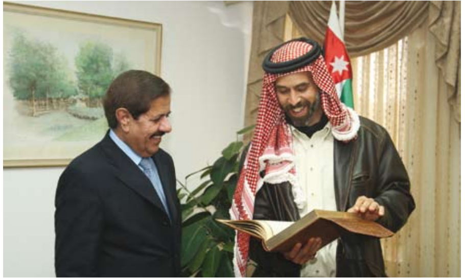
الدكتور الكركي يقدم الهدية لسمو الأمير غازي

الجامعة - كرمت الجامعة سمو الأمير غازي بن محمد المبعوث الشخصي المستشار الخاص لجلالة الملك في الثامن عشر من نيسان الماضي لحصوله على درجة الدكتوراه مع مرتبة الشرف الأولى من كلية أصول الدين في جامعة الأزهر الشريف. وبارك رئيس الجامعة الدكتور خالد الكركي لسموه خلال زيارته للجامعة على هذا الانجاز مشيداً بجهود سموه العلمية على كافة الصعد المحلية والعربية والعالمية. وتحدث سموه عن تجربته العلمية والبحثية الثرية في الأزهر الشريف الذي يعتبر من أعرق الجامعات وأقدمها واحد المراجع الدينية المهمة في العالمين العربي والإسلامي. وأعرب سموه عن تقديره للجامعة... التتمة ص ٨