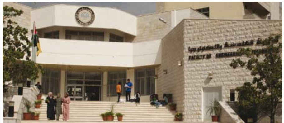
طلبة الجامعة يحصدون الجوائز

الجامعة - تصدر فريق من طلبة كلية الهندسة والتكنولوجيا في الجامعة الأردنية المركز الأول في مسابقة تصاميم إبداعية للمساكن الخضراء التي نظمتها مسابقة الملكة علياء للمسؤولية الاجتماعية في الصندوق الأردني الهاشمي للتنمية البشرية.